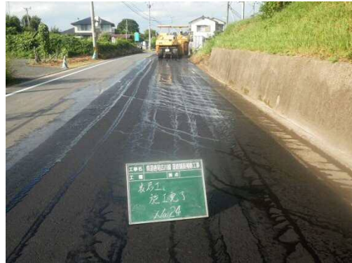
写真-2. 県道唐尾広川線道路舗装補修工事の施工前（左）と施工後（右）