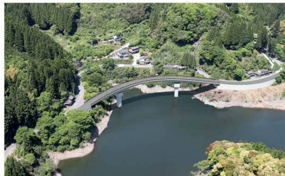
写真-1. 日向神改良 道路改良事業完成イメージ図