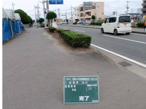
写真-3. 国道 442 号道路植栽剪定工事の施工前（左）と施工後（右）