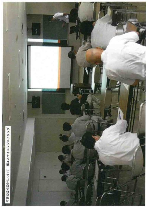
甲府交差点設計について 新エスケイエンジニアリング